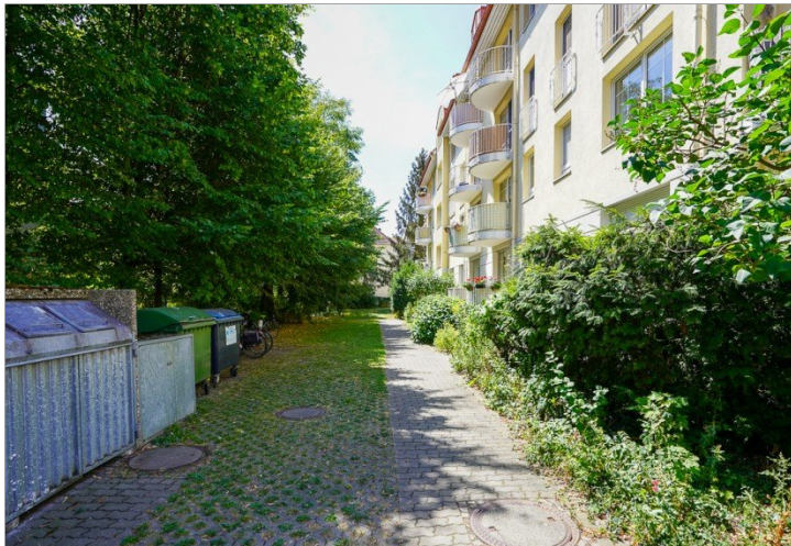
Zuwegung zum Hauseingang