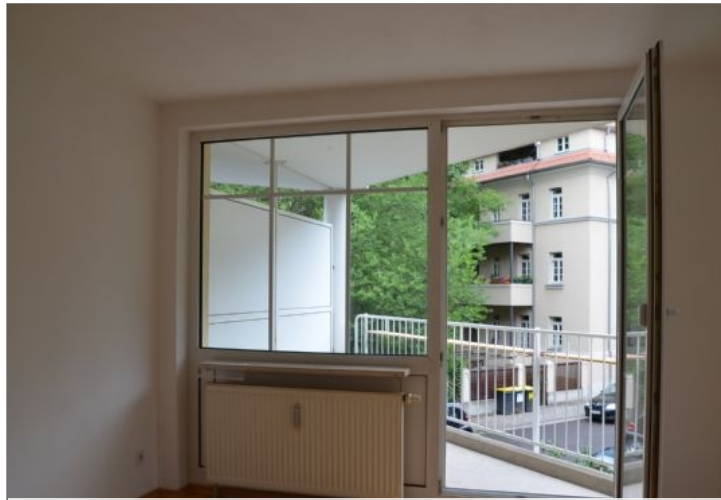
Wohn-/Schlafzimmer mit Balkon