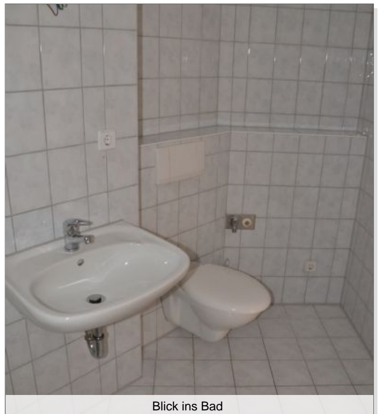
Blick ins Bad