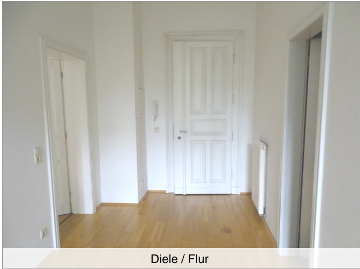
Diele / Flur