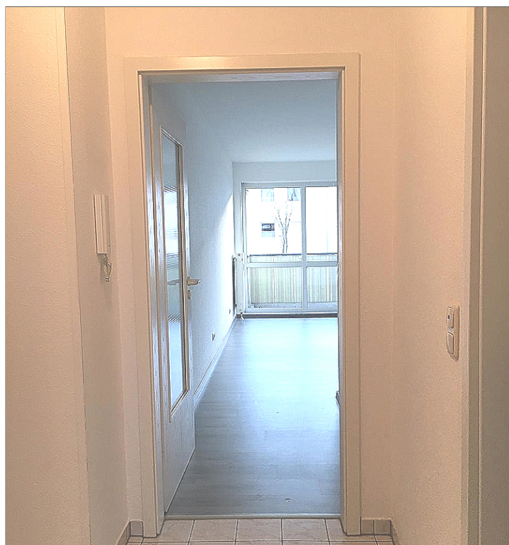
Flurbereich mit Zugang zum WZ