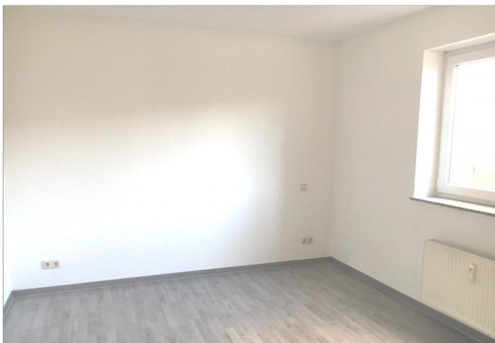
Schlafzimmer Bild 2