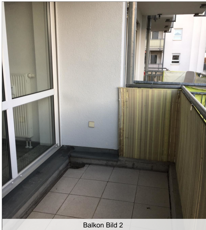
Balkon Bild 2