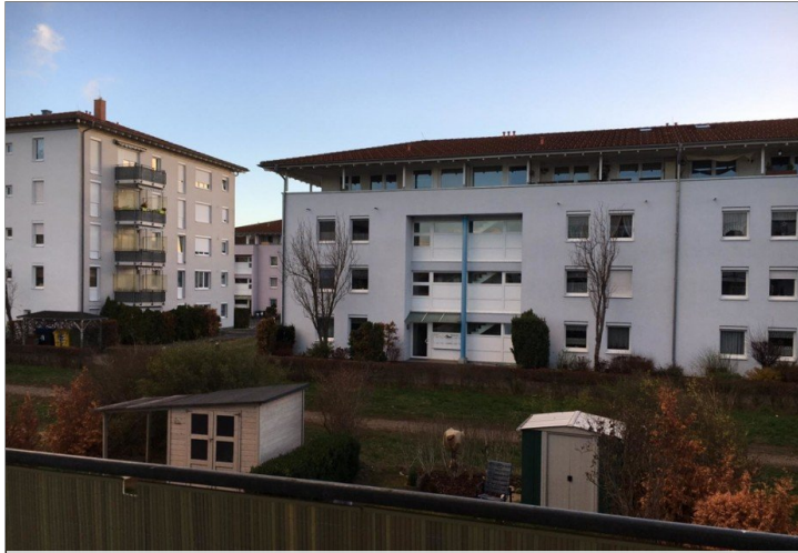
Balkon am WZ