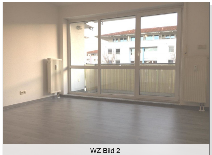
WZ Bild 2