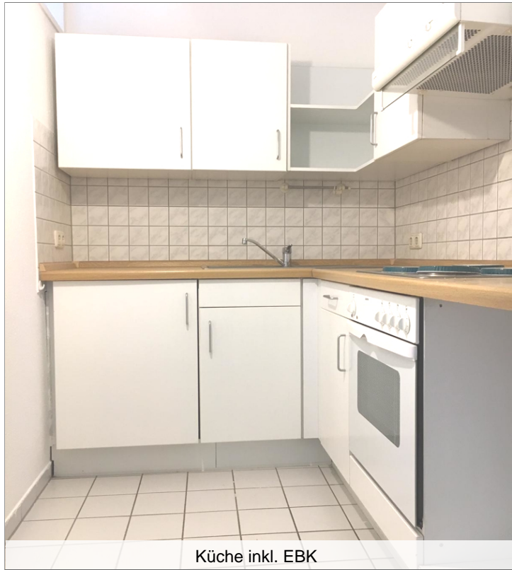
Küche inkl. EBK