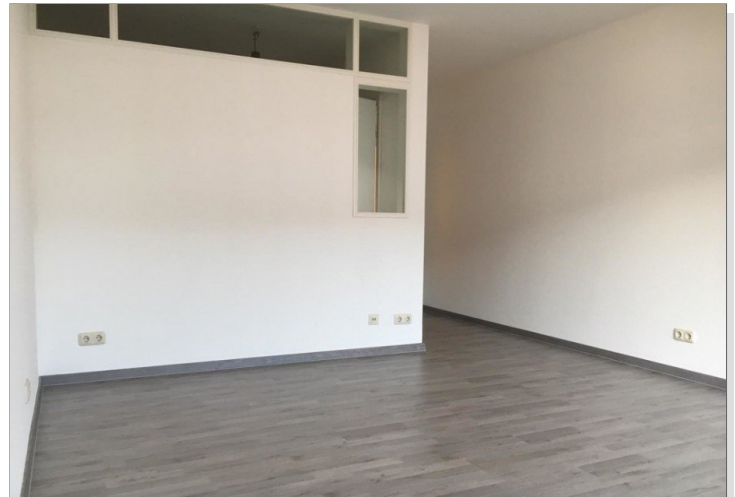
WZ Bild 1