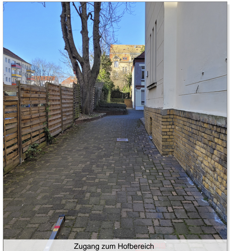
Zugang zum Hofbereich