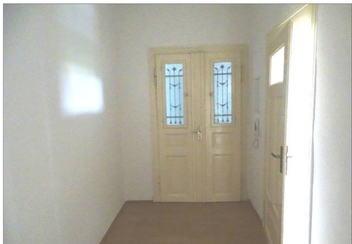
Diele / Flur