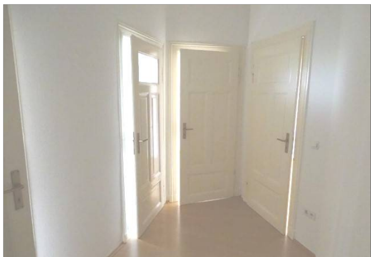
Diele / Flur