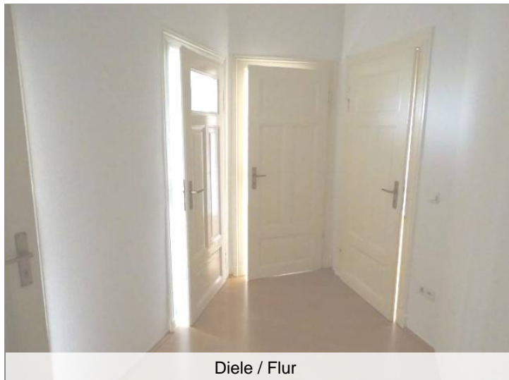
Diele / Flur