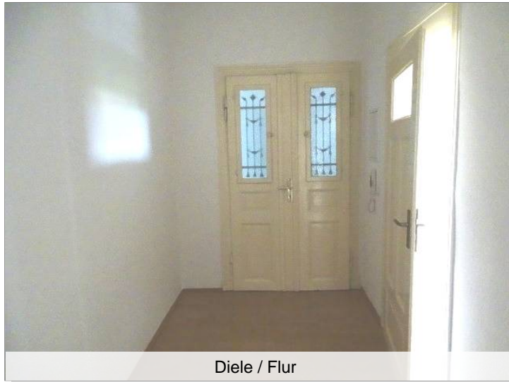
Diele / Flur