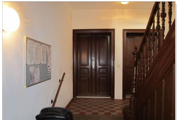
Treppenhaus - Eingangsbereich