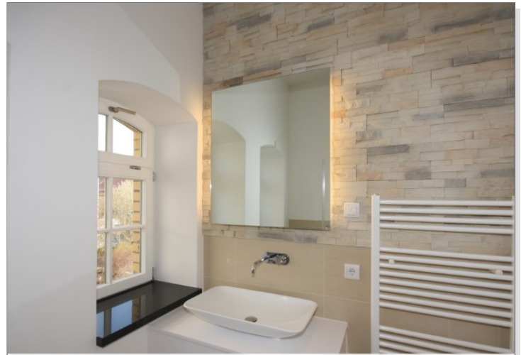
Bad inkl. Dusch obere Ebene