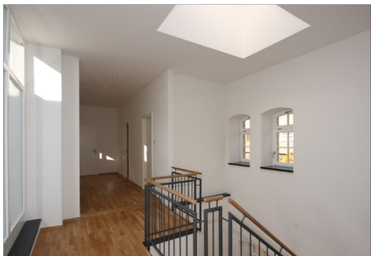
Galerie obere Ebene Bild 2