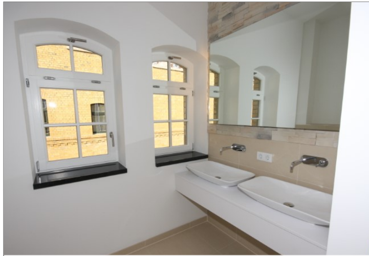
Bad mit Dusche obere Ebene