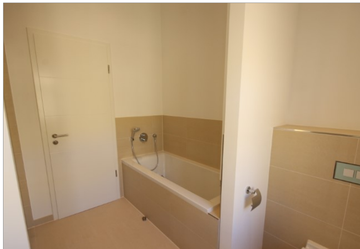
Bad inkl. Wanne u. Dusche obere Ebene