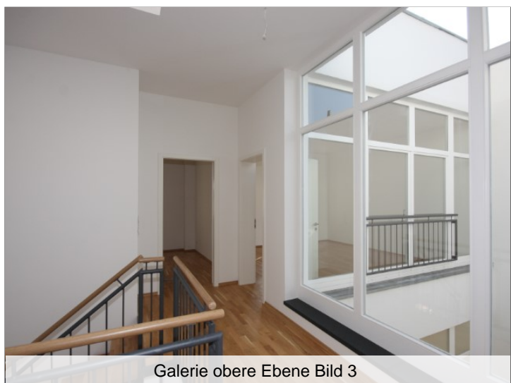
Galerie obere Ebene Bild 3