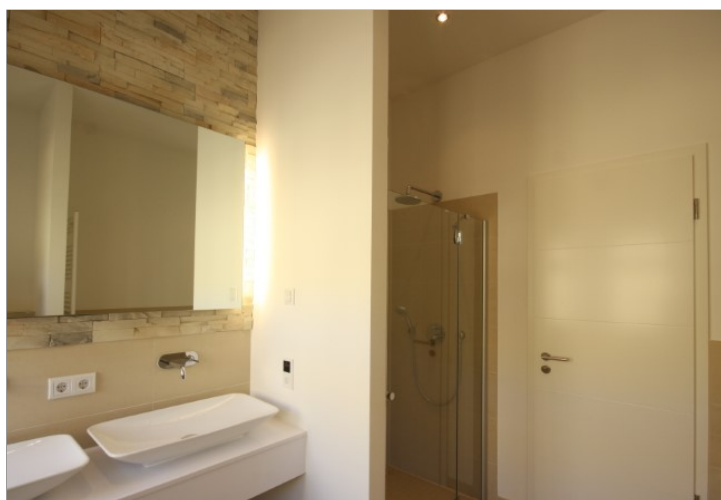
Bad mit Wanne und Dusche obere Ebene