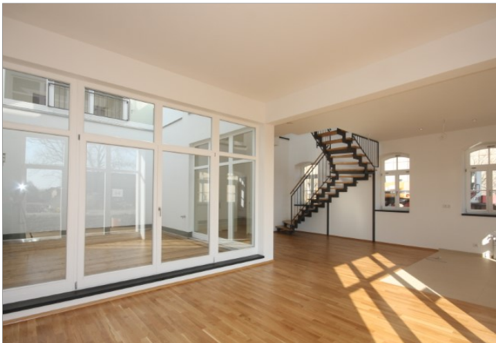
Wohnzimmer mit Blick zum Atrium