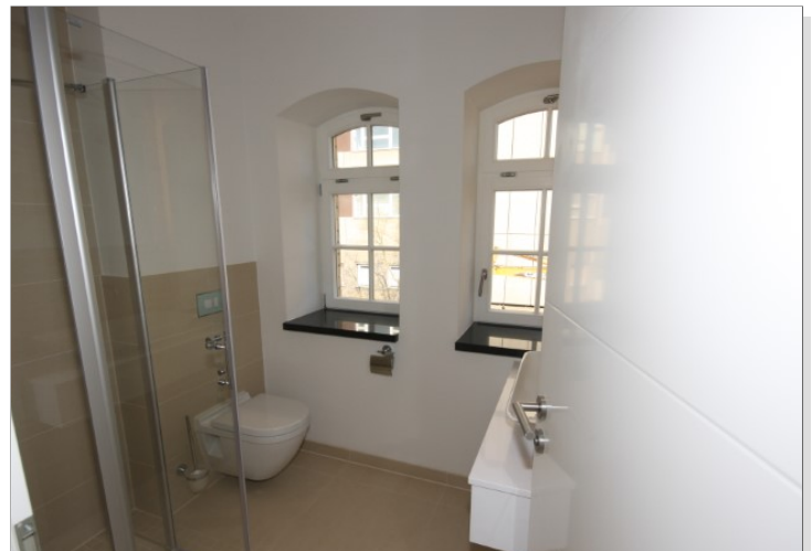
Bad inkl. Dusche obere Ebene