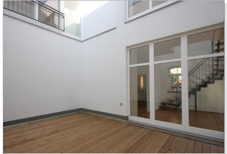
Atrium Bild 4