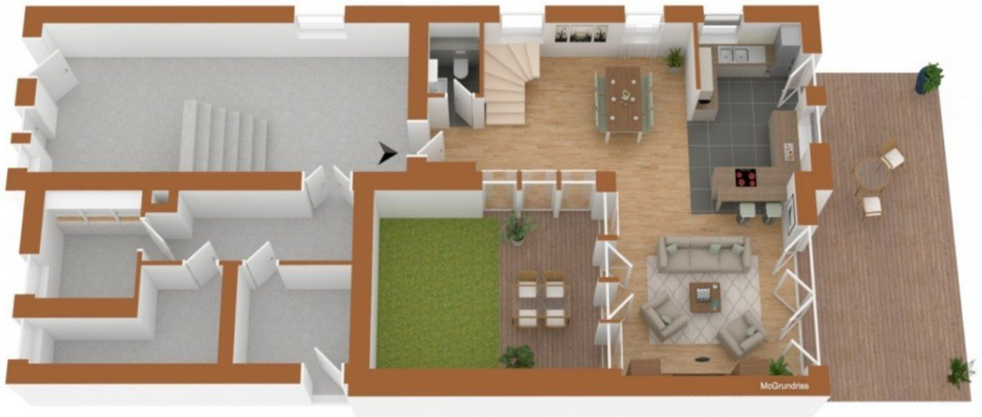
Grundriss 3D EG