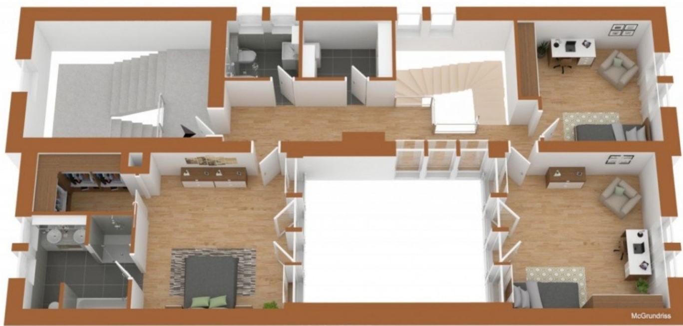
Grundriss 3D 1.OG