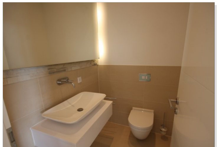
Gäst-WC untere Ebene