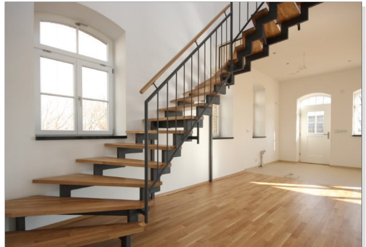
Treppenaufgang zur 2. Ebene