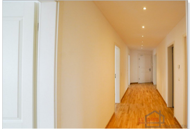
Diele / Flur