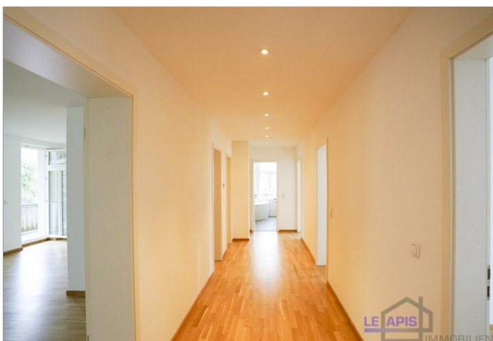
Diele / Flur