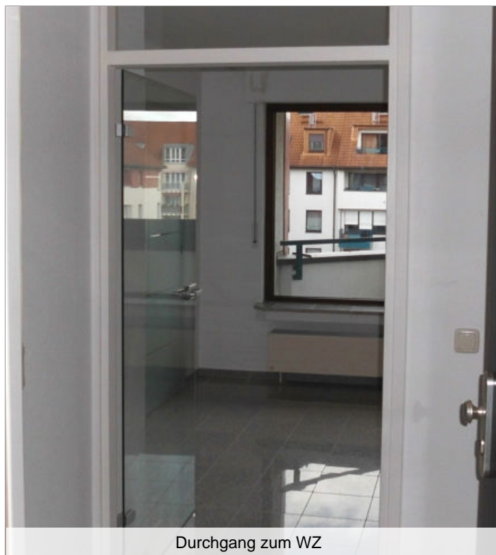
Durchgang zum WZ