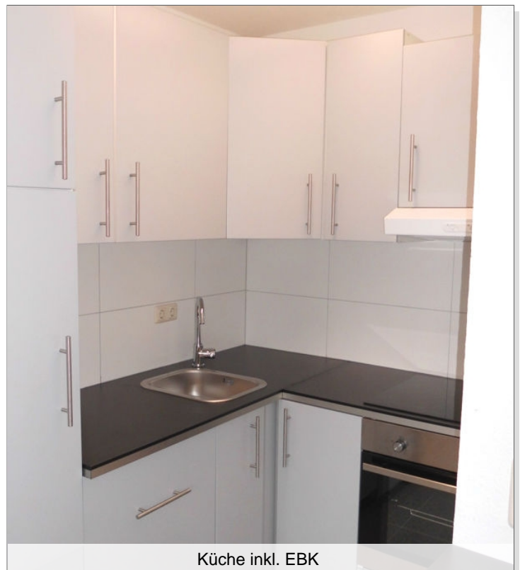
Küche inkl. EBK