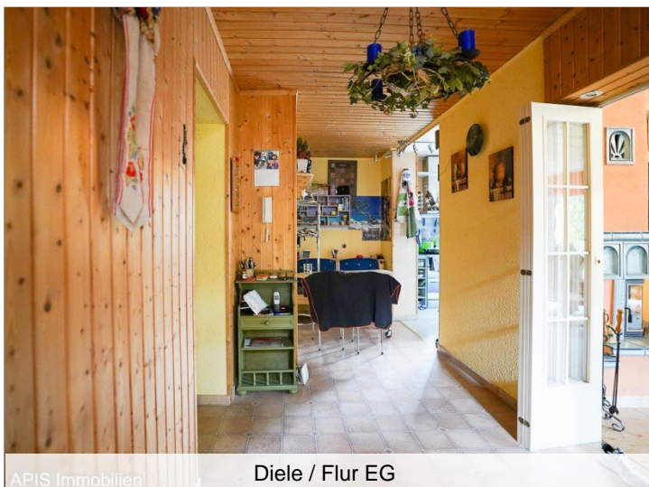
Diele / Flur EG