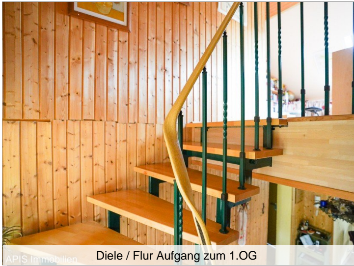
Diele / Flur Ausgang zum 1.OG