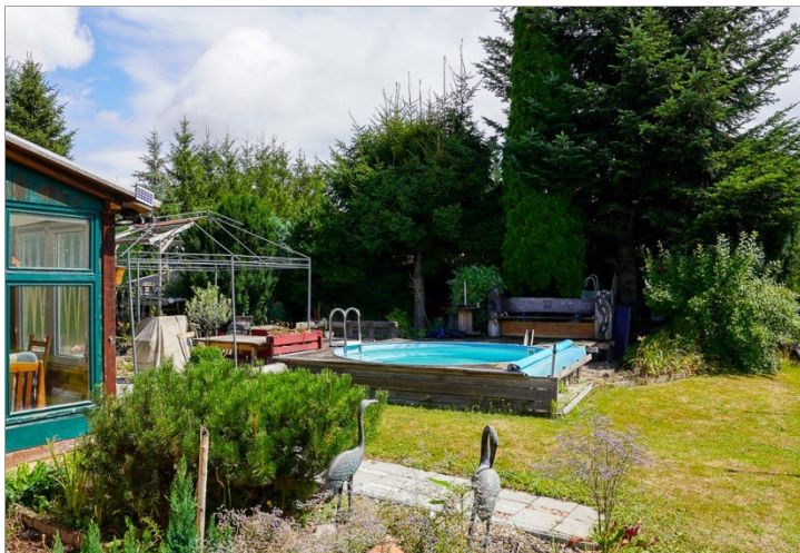
Garten mit Pool