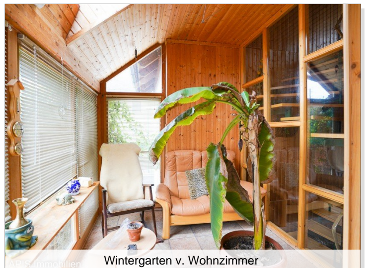
Wintergarten v. Wohnzimmer