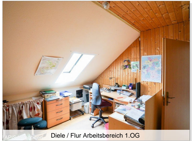
Diele / Flur Arbeitsbereich 1.OG