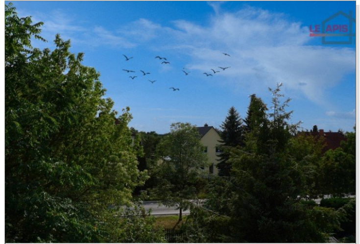
Ausblick vom Dachgeschoss