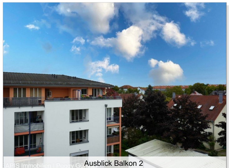
Ausblick Balkon 2