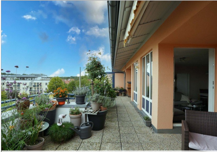
Ausblick Balkon 1