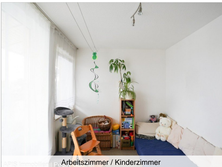
Arbeitszimmer / Kinderzimmer