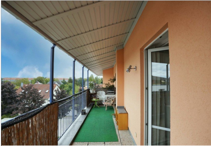
Ausblick Balkon 2