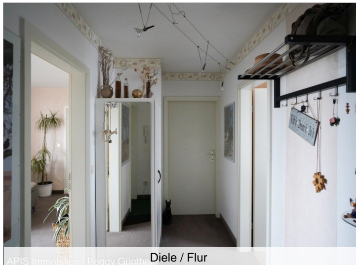
Diele / Flur