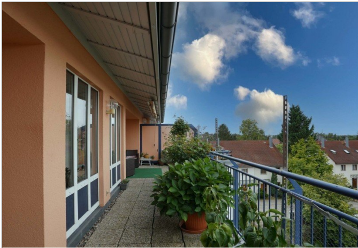
Ausblick Balkon 1