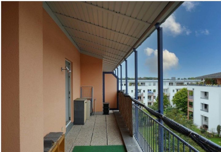
Ausblick Balkon 2