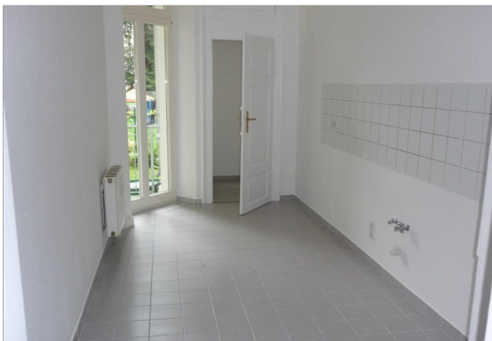
Küche mit Balkonzugang