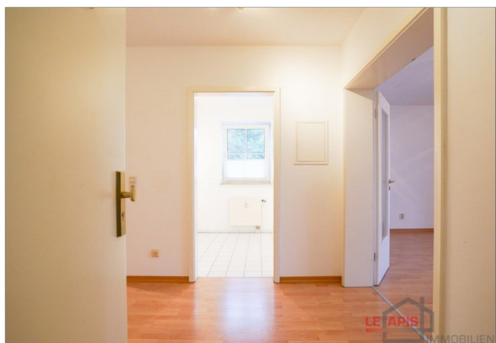
Diele / Flur