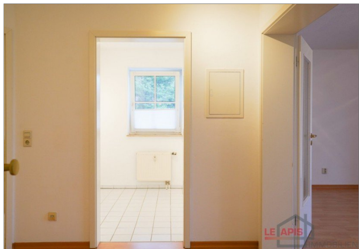
Diele / Flur