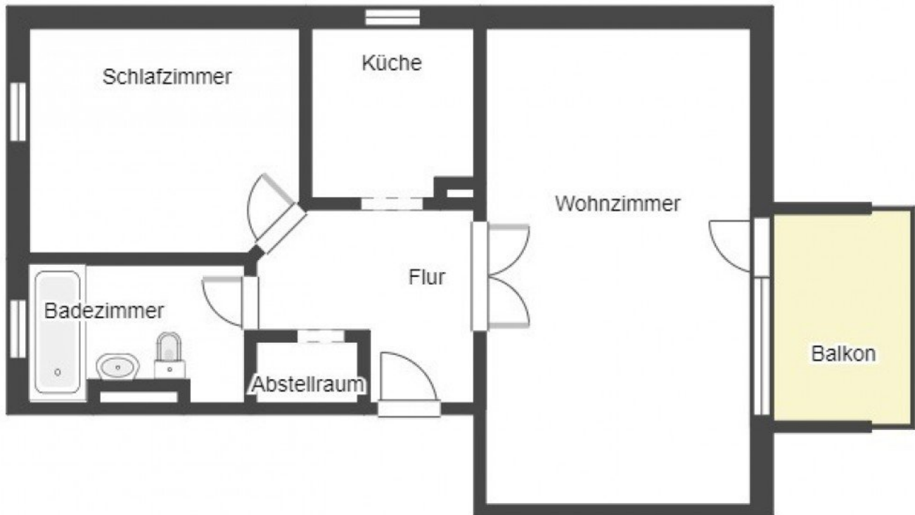
Grundriss 1. Etage