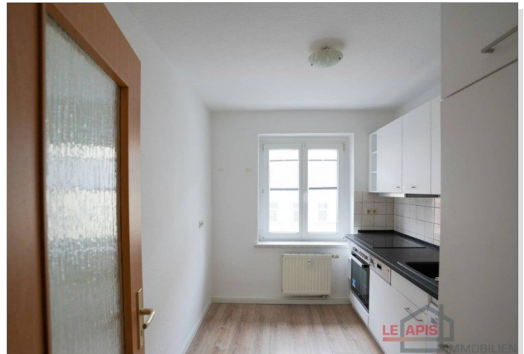
Küche mit EBK