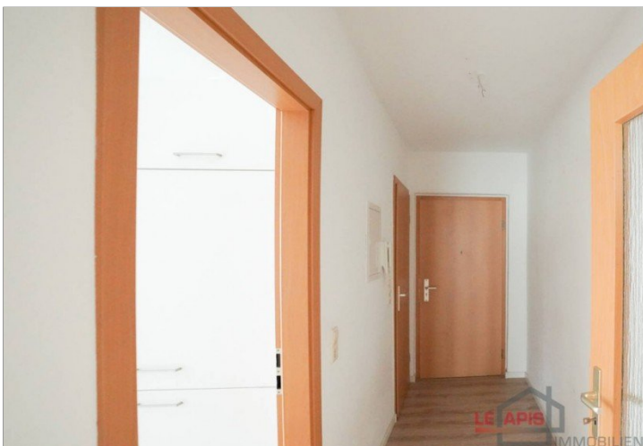
Diele / Flur