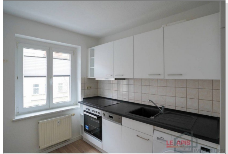
Küche mit EBK