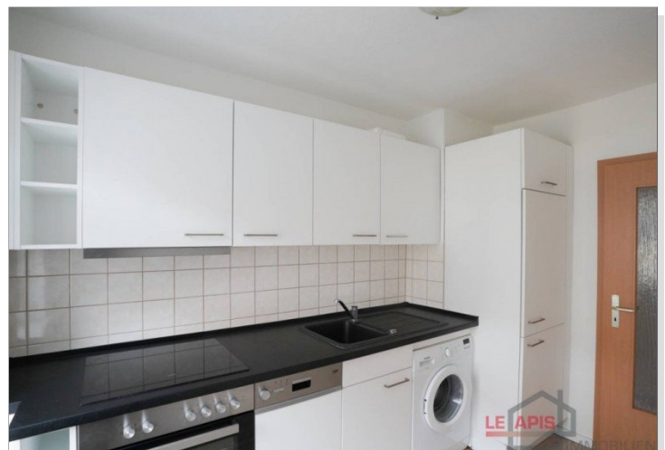
Küche mit EBK