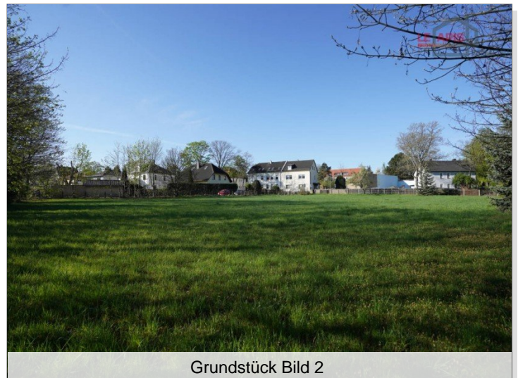
Grundstück Bild 2